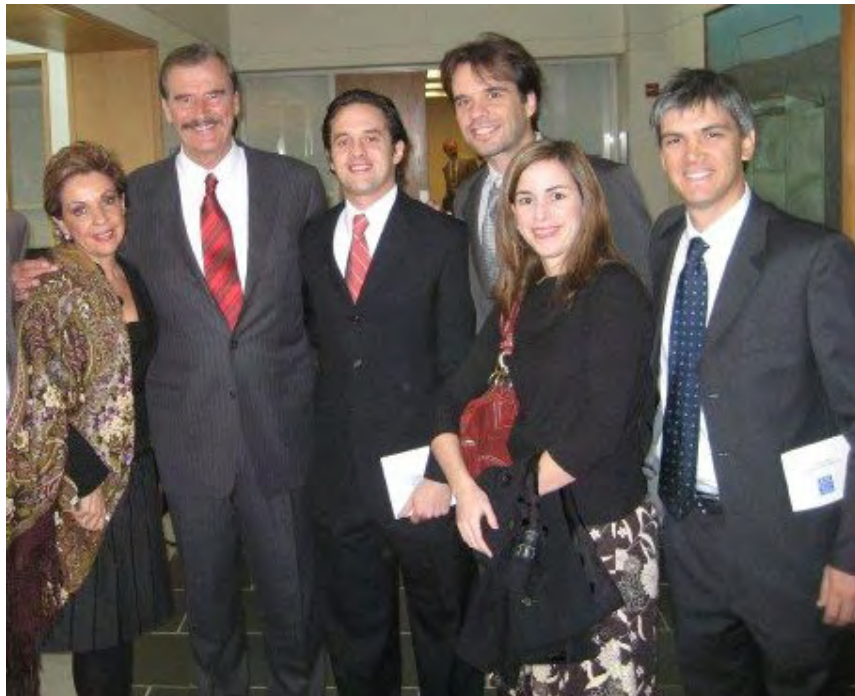
Visita del Ex Presidente de México Sr. Vicente Fox.

Durante las fiestas de fin de año he decidido recorrer un poco EEUU. Espero que sean unas vacaciones inolvidables!!!