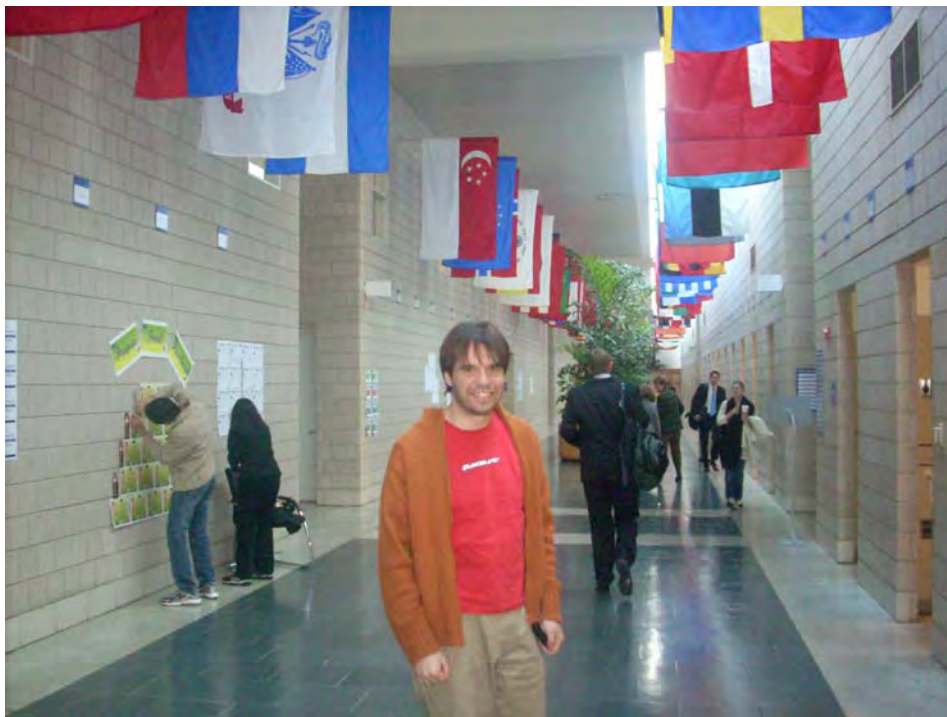
El pabellón principal de la Escuela.

En dos semanas más termina este primer modulo y ya tengo pensado participar en uno de los viajes organizados por la Universidad para la semana de vacaciones: Ir a New York a conocer bancos de inversión y otras instituciones financieras.